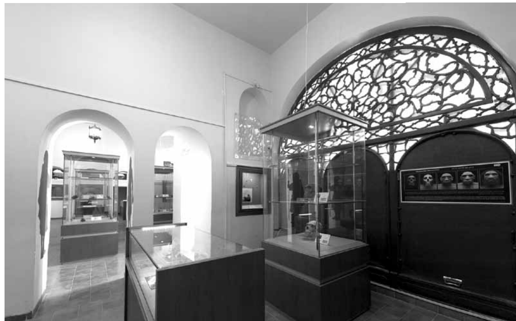
موزه پارینه سنگی

چشم‌ها در حیاط می‌رقصند و می‌گردند و نه یک بار بلکه بارها و بارها همه چیز را به نظاره می‌نشینند، همان‌طور که اشاره شد، ضلع جنوبی به موزه پارینه سنگی (زاگرس) اختصاص دارد و غیر از ورودی، شامل سه اتاق تودرتو است. اتاق‌ها به وسیله درهای میانی به هم ربط دارند و دارای ارسی هستند و راه دسترسی به آن‌ها دو سه پله سنگی داخل حیاط است. کف‌پوش کنونی آن سرامیک قهوه‌ای رنگ است ولی سابقاً آجر بوده است. این فضاها در آخر به راهرویی متصل می‌شوند که هم به حسینییه و هم به حیاط پشتی و حمام بیگلربیگی (حمام